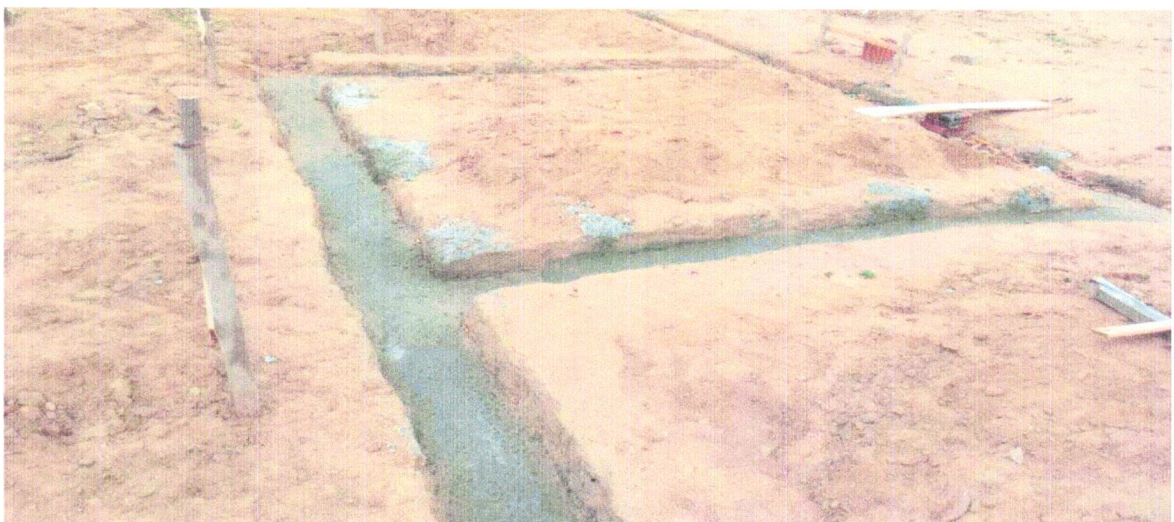
14 - LASTRO DE CONCRETO MAGRO, APLICADO EM BLOCOS DE COROAMENTO OU SAPATAS, ESPESSURA DE 3 CM.