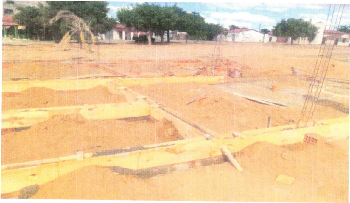
FOTO 11 – ATERRO MANUAL DE VALAS COM AREIA PARA ATERRO E COMPACTAÇÃO MECANIZADA. AF_05/2016