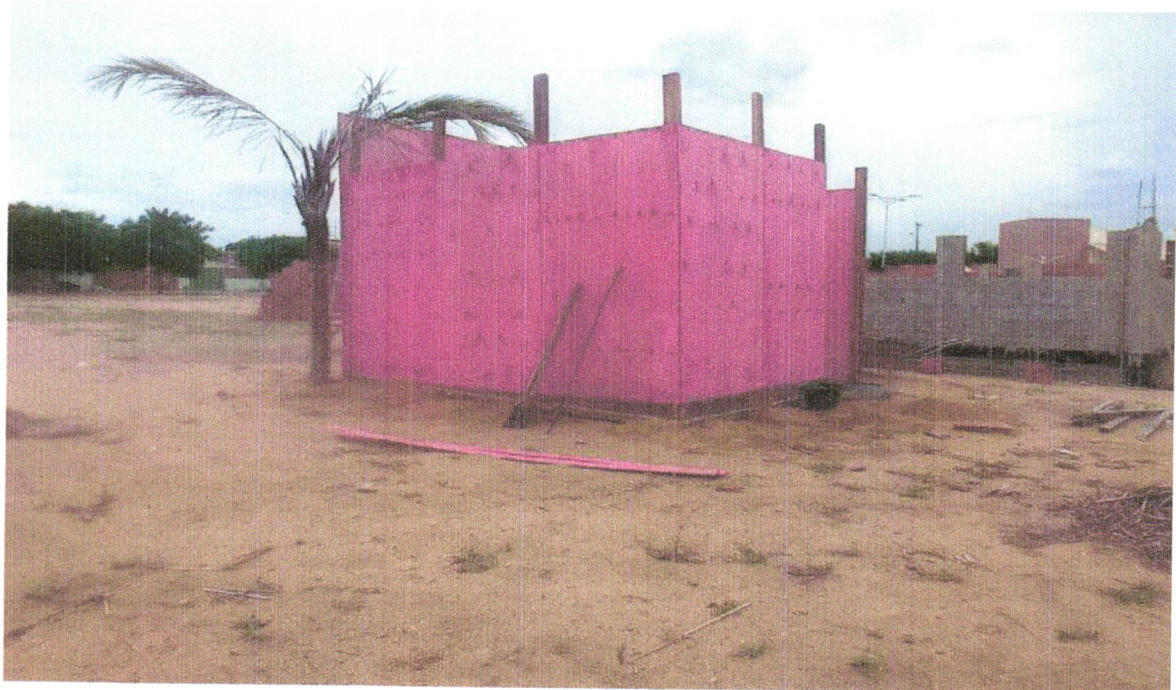
FOTO 10 - Barracão para Obras de Médio Porte Reaproveitamento