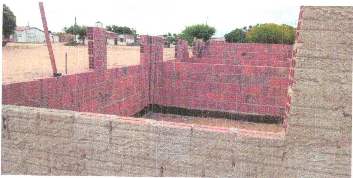
Foto 06– ALVENARIA DE VEDAÇÃO DE BLOCOS CERÂMICOS FURADOS NA VERTICAL DE 9X19X39CM (ESPESSURA 9CM) DE PAREDES