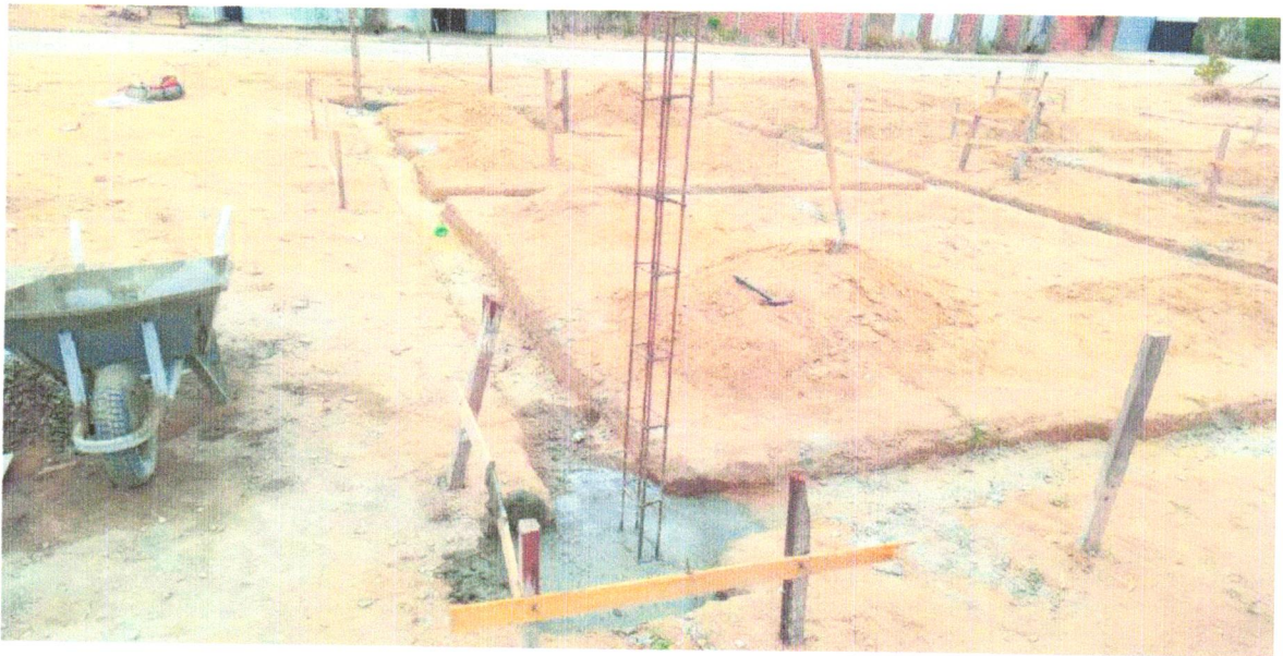
FOTO 05 – ESCAVAÇÃO MANUAL DE VALA PARA VIGA BALDRAME (INCLUINDO ESCAVAÇÃO PARA COLOCAÇÃO DE FÔRMAS). AF_06/2017