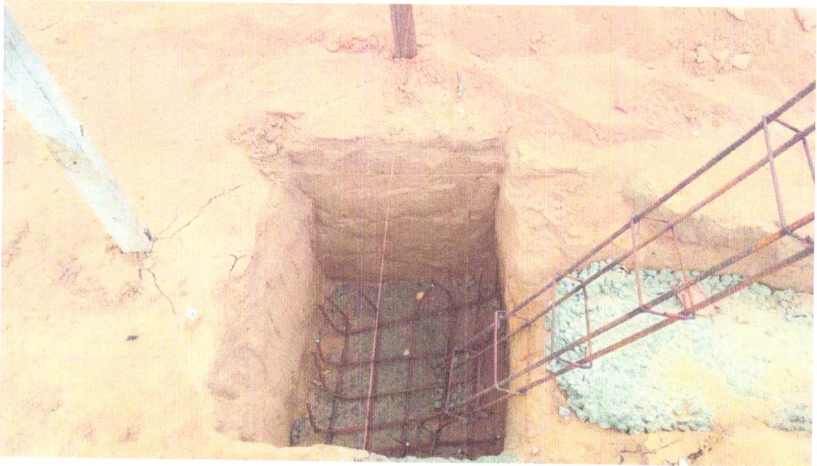
FOTO 03 - ESCAVAÇÃO MANUAL PARA BLOCO DE COROAMENTO OU SAPATA (INCLUINDO ESCAVAÇÃO PARA COLOCAÇÃO DE FÔRMAS). AF_06/2017