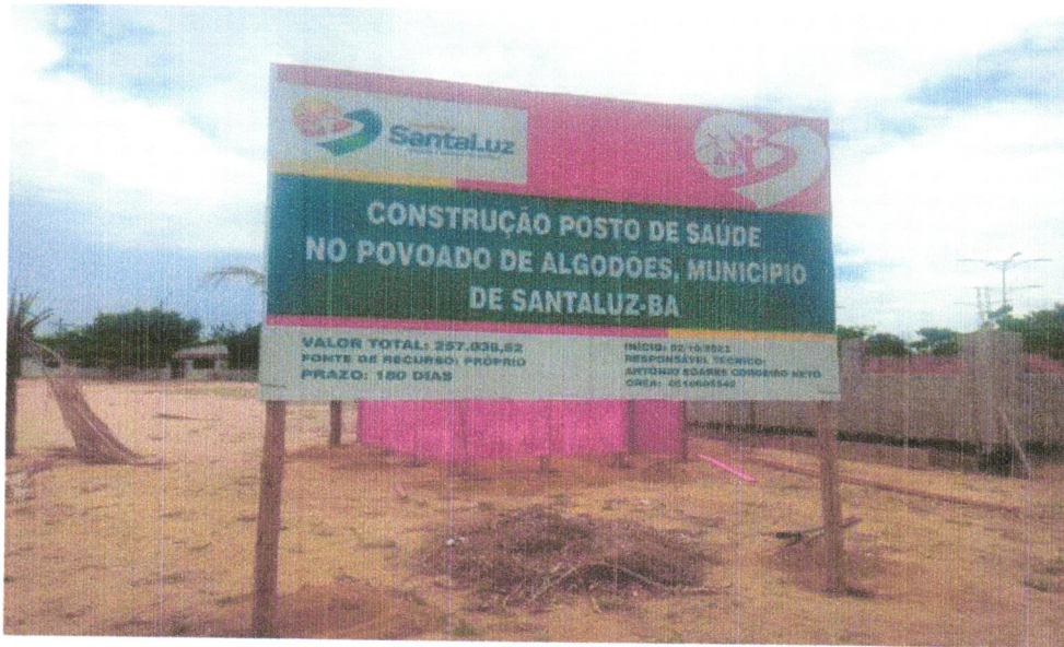
FOTO 01 - Placa de obra em chapa aço galvanizado, instalada - Rev 02_01/2022