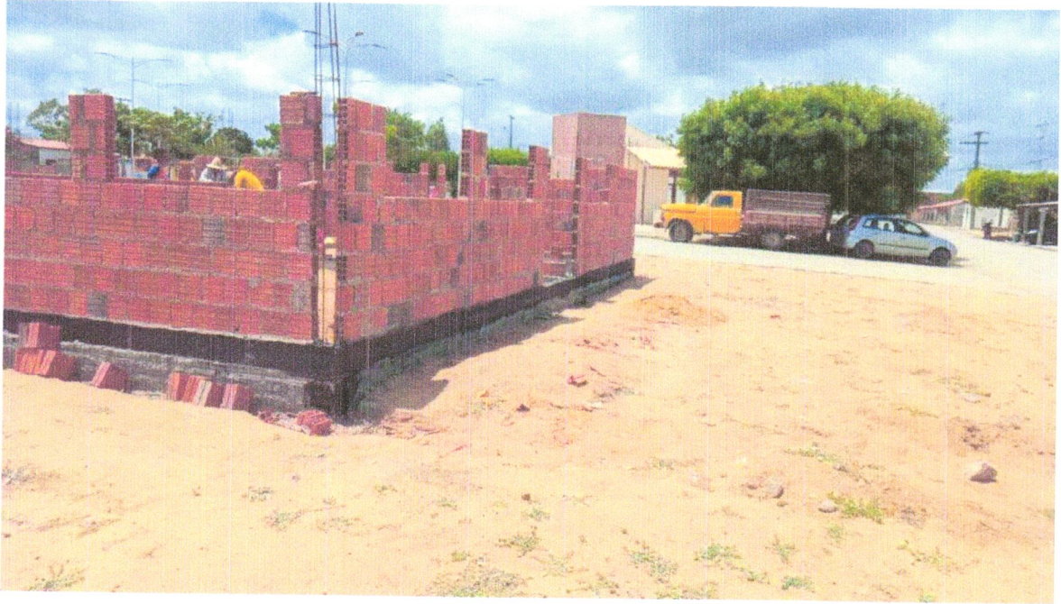
FOTO 7 – IMPERMEABILIZAÇÃO DE SUPERFÍCIE COM EMULSÃO ASFÁLTICA, 2 DEMÃOS AF_06/2018