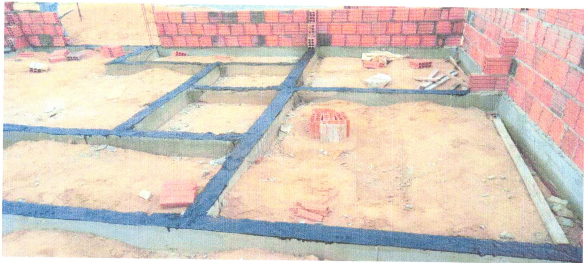
FOTO 12 - IMPERMEABILIZAÇÃO DE SUPERFÍCIE COM EMULSÃO ASFÁLTICA, 2 DEMÃOS AF_06/2018