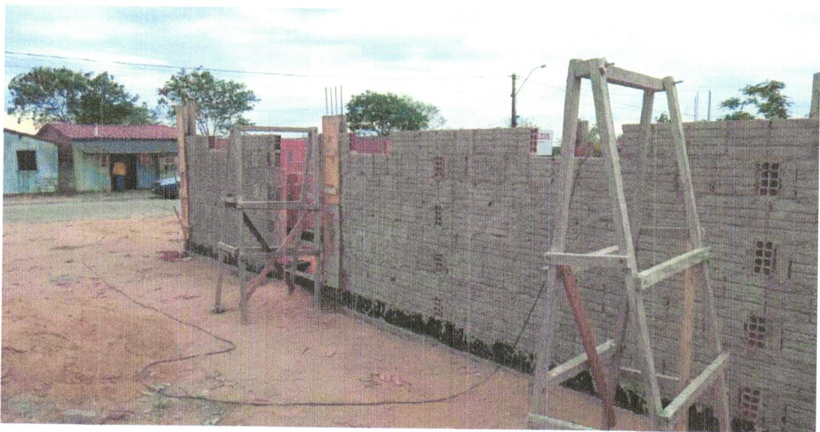
FOTO 8 - CHAPISCO APLICADO EM ALVENARIAS E ESTRUTURAS DE CONCRETO INTERNAS, COM COLHER DE PEDREIRO. ARGAMASSA TRAÇO 1:3 COM PREPARO EM BETONEIRA 400L. AF_06/2014