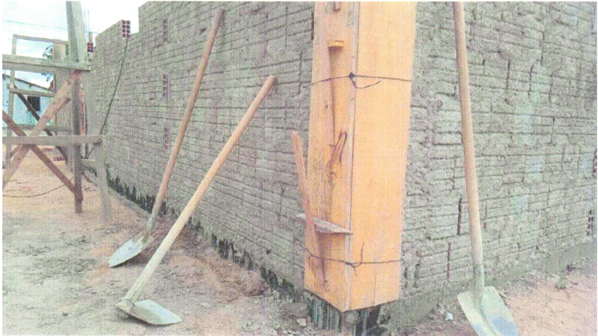
FOTO 13 – (COMPOSIÇÃO REPRESENTATIVA) EXECUÇÃO DE ESTRUTURAS DE CONCRETO ARMADO, PARA EDIFICAÇÃO HABITACIONAL UNIFAMILIAR TÉRREA (CASA EM EMPREENDIMENTOS), FCK = 25 MPA. AF_01/2017 E CHAPISCO APLICADO EM ALVENARIAS E ESTRUTURAS DE CONCRETO INTERNAS, COM COLHER DE PEDREIRO. ARGAMASSA TRAÇO 1:3 COM PREPARO EM BETONEIRA 400L. AF_06/2014