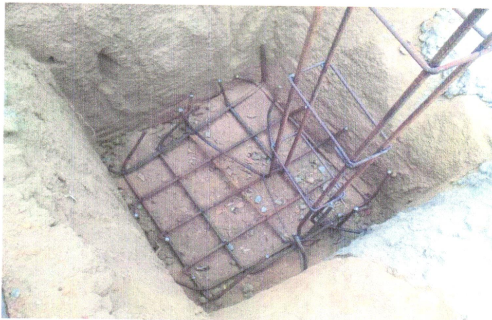
FOTO 02 - - ESCAVAÇÃO MANUAL PARA SAPATA AF_06/2017